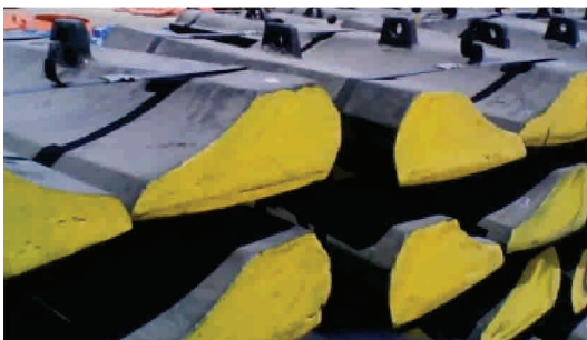
REVESTIMIENTOS MOLINOS Acero al Cromo - Mb